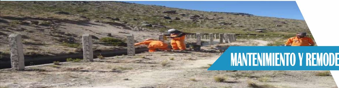
MANTENIMIENTO Y REMODELACIÓN