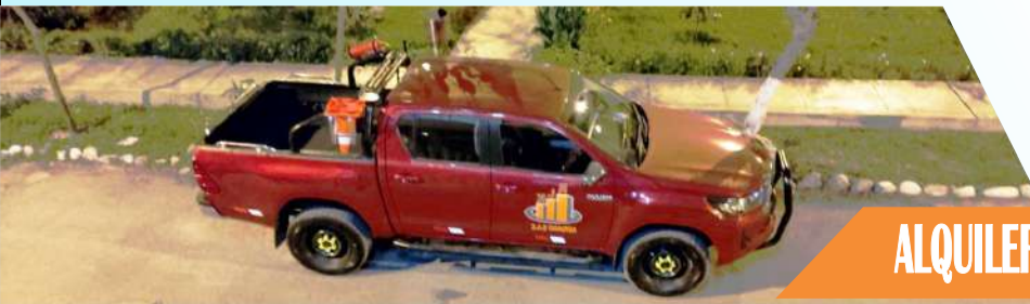
ALQUILER DE EQUIPO LIVIANO