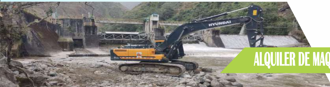
ALQUILER DE MAQUINARIA