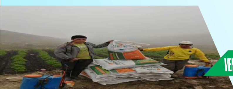
VENTA PRODUCTOS AGRÍCOLAS Y DE CONSTRUCCIÓN