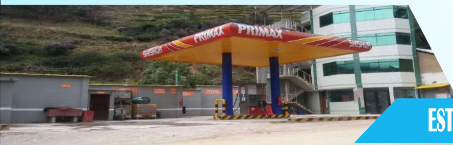
ESTACION DE SERVICIOS